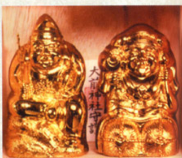
大前神社のご祭神、恵比寿様と大国様の黄金の縁起物。一家にひとつは欲しい！(5000円〜)

全国から「宝くじが当たりました！」のお礼が続々寄せられているが、高額当せんのお礼もけっこうあるらしい！